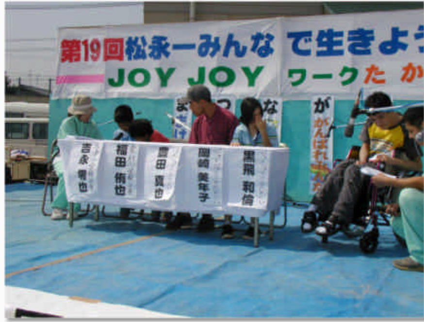
子ども福祉フォーラムの様子」

二〇〇六年九月三十日、福山市立松永中学校にて、「第19回まつながみんなで生きよう考えよう」テーマ「進めよう地域福祉」を開催いたしました。当日は天候にも恵まれ、大勢の地域の皆様にご来場頂き、盛大にまた楽しく開催することができました。関係者一同心より御礼申し上げます。この行事は、たくさん地域の皆様にご来場頂き、活動紹介パネル展や、障害を持つ方たちの直接のふれあいを