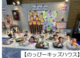
【のっぴーキッズハウス】