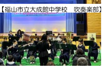
【福山市立大成館中学校 吹奏楽部】