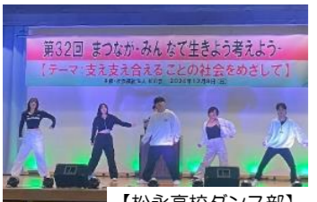
【松永高校ダンス部】