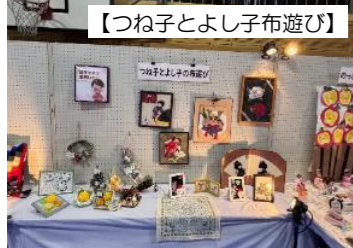
【つね子とよし子布遊び】

12月8日、「第32回まつながみんなで生きよう考えよう～支え支え合うことのできる社会をめざして～」を5年ぶりに開催しました。この度、特別企画では災害対策フォーラムや避難体験コーナーを通じて地域の方々と意見交換もでき、実りあるものとなりました。また、第1会場のステージでは福祉音楽祭や美術芸術展に地元で活躍しておられる団体の皆様に参加いただき華やかな会場となりました。また子育て支援コーナーでは絵本の読み聞かせなどを行い、参加した子どもたちにはたくさんの笑顔が見られました。第2会場では避難訓練時のパネルや災害時に使える備品展示、ジョイジョイワーク味自慢のフードコーナー、子どもが楽しめる広場、思い出写真館を設け、来場した皆様との交流を楽しみました。5年振りの開催ではありましたが、ご支援・ご協力して下さった地域・企業・ボランティアの皆様のおかげをもちまして無事に盛大に終えましたこと関係者一同心よりお礼申し上げます。