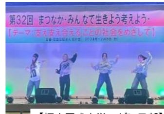
【福山平成大学 ダンス部】