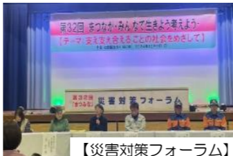
【災害対策フォーラム】