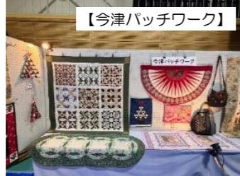
【今津パッチワーク】