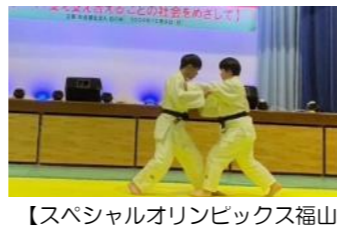
【スペシャルオリンピックス福山 柔道アスリート】