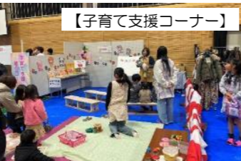
【子育て支援コーナー】